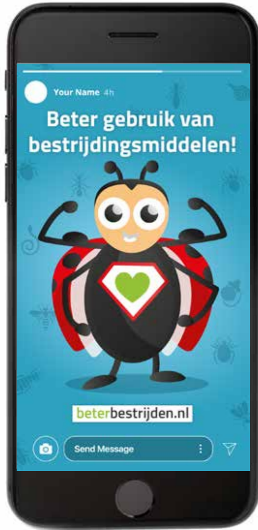
Instagram / facebook story