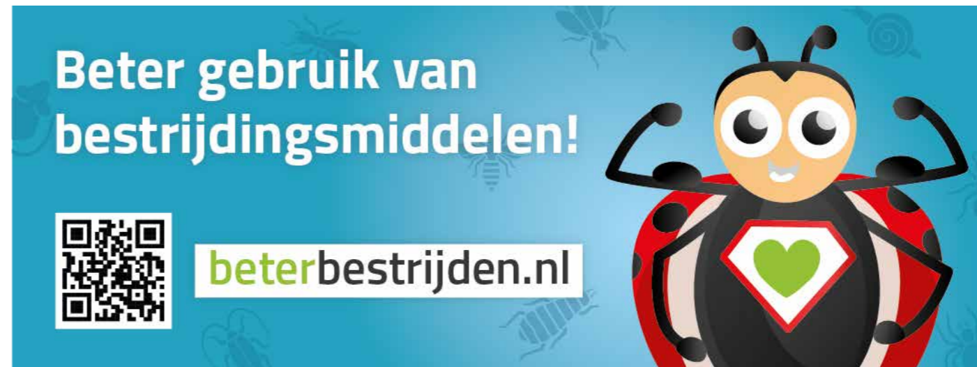
Sticker / banner