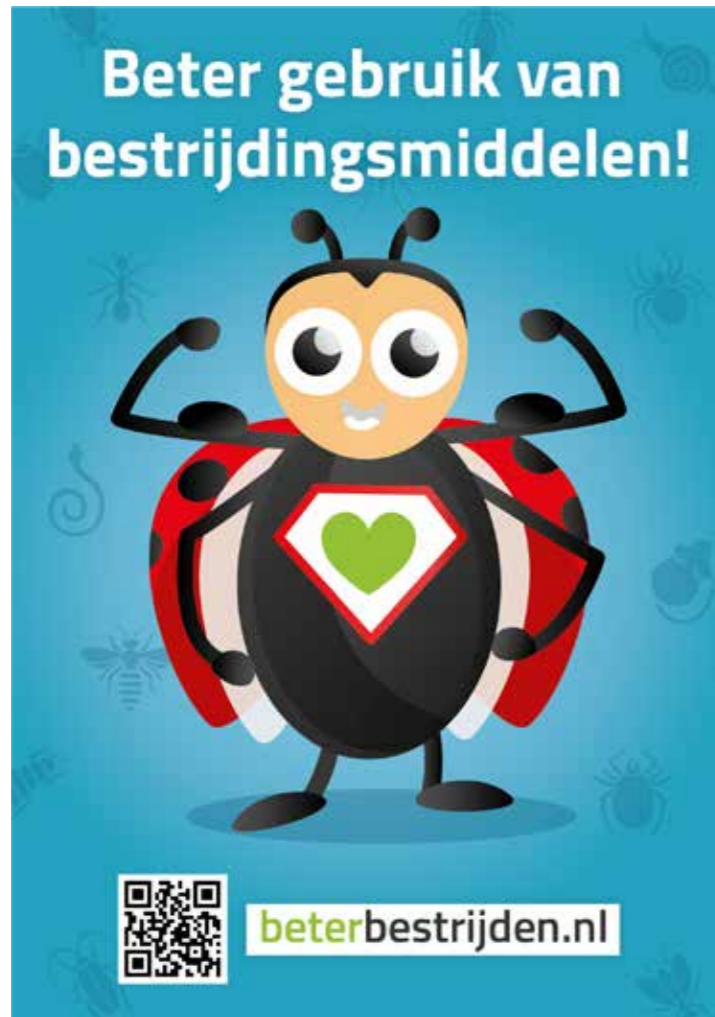
Poster / flyer