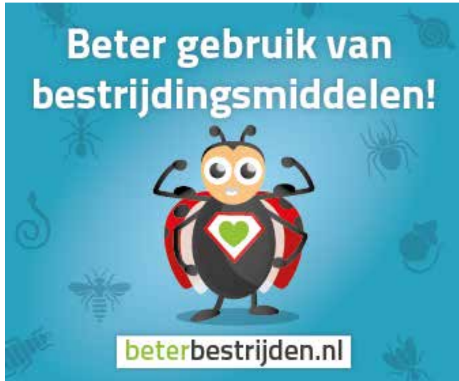
Online banners in diverse formaten