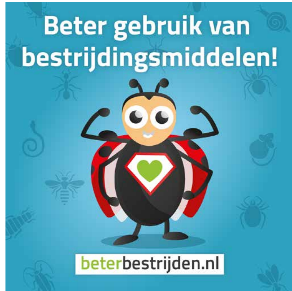
Facebook bericht / advertentie 1200 x 1200 px